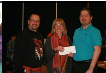
Fonds Centre scolaire Léo-Rémillard