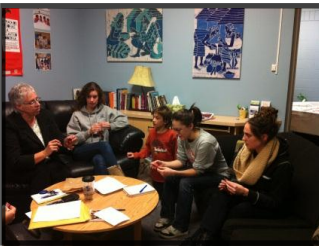
Projet Réconciliation du Service d'animation spirituelle de l'USB