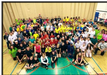
Fonds commémoratif Luc-Gosselin