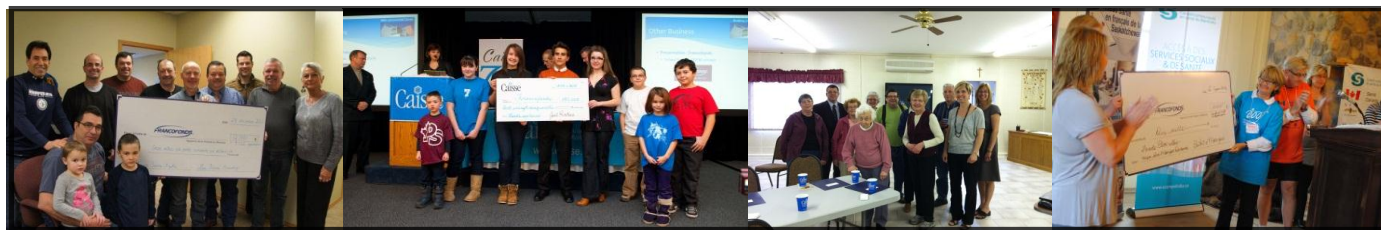
Les Frères Baudry appuient le Fonds communautaire Sainte-Agathe