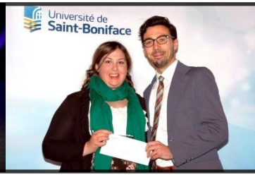
Bourse d'études Francofonds à l'USB