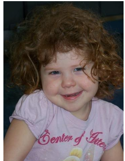
Les Étoiles d'la Rouge