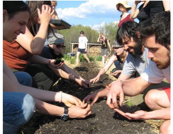
Conseil jeunesse provincial