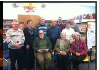
Bibliothèque de Sainte-Anne