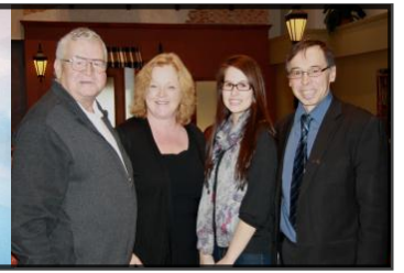
Bourse d'études du Fonds CDEM