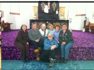
Corporation du site historique de l'Enfant-Jésus – Richer