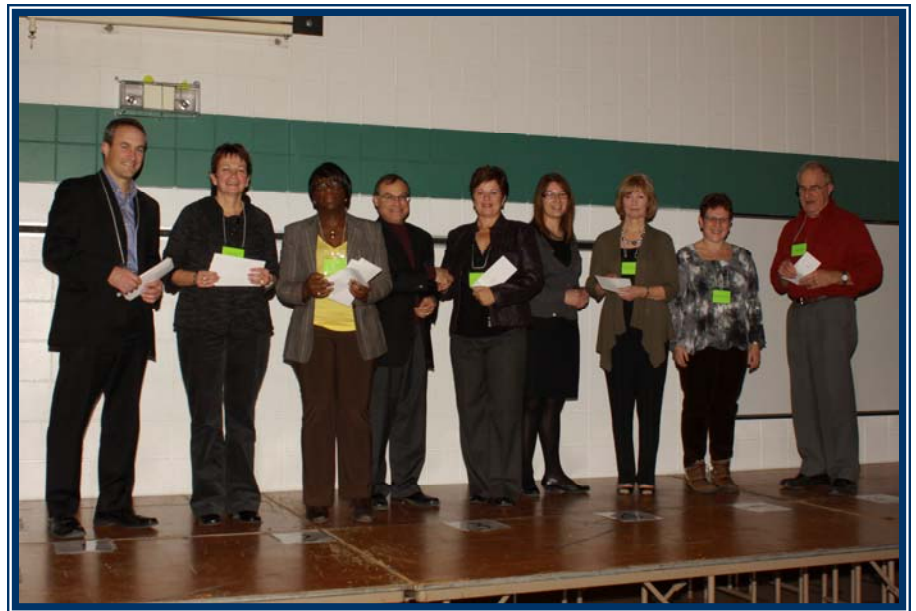
Le Centre Flavie-Laurent, l'Entre-temps, Habitat chez soi, l'Hôpital Saint-Boniface et Pluri-elles reçoivent leurs subventions des responsables de fonds : Fonds Saurette-Penner, Fonds Habitat chez soi, Fonds Hôpital Saint-Boniface, Fonds Lécuyer.