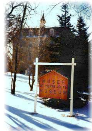
Le musée a été déclaré site patrimonial provincial en 1989.

« Nous sommes actuellement occupés à rénover la salle de classe traditionnelle selon le modèle de 1938 », indique René Desharnais.