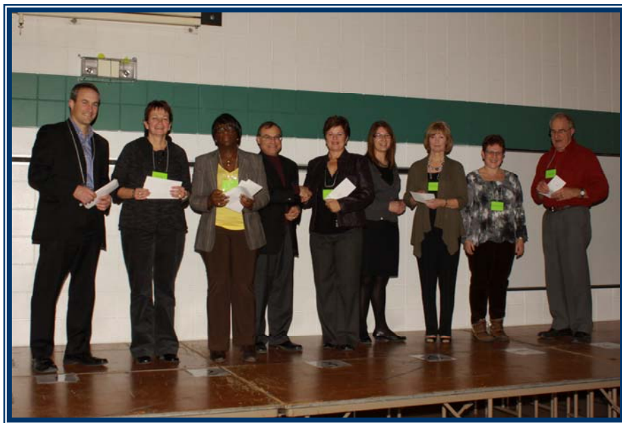
Le Centre Flavie-Laurent, l'Entre-temps, Habitat chez soi, l'Hôpital Saint-Boniface et Pluri-elles reçoivent leurs subventions des responsables de fonds : Fonds Saurette-Penner, Fonds Habitat chez soi, Fonds Hôpital Saint-Boniface, Fonds Lécuyer.